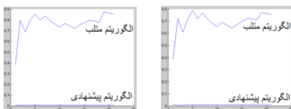
(ا) نمودار مقایسه خطای MAE مثال ۱ با برنامه پیشنهادی و برنامه متلب (ب) نمودار مقایسه خطای RMSE مثال ۱ با برنامه پیشنهادی و برنامه متلب