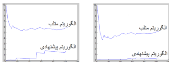
(ا) نمودار مقایسه خطای MAE برای برنامه پیشنهادی و برنامه متلب اجرا شده روی داده‌های واقعی (ب) نمودار مقایسه خطای RMSE برای برنامه پیشنهادی و برنامه متلب اجرا شده روی داده‌های واقعی

نمودارهای مربوط به معیار MAE و RMSE چنان که در شکل ۱ نمایش داده شده است، به صورت پیوسته رسم شده و محور افقی و عمودی، به ترتیب، بیان‌گر تعداد داده‌ها و مقدار خطا است. نمودارهای مربوط به خطای نسبی که در شکل ۲ آمده است، به صورت نقطه‌ای ترسیم شده‌اند و محور افقی و عمودی، به ترتیب، بیان‌گر اندیس داده‌ها و مقدار خطای نظیر هر اندیس است.